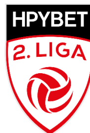
Bewerbslogo zweithöchste Spielklasse