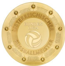
Admiral Bundesliga Fotografie