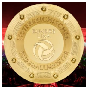
Kein unruhiger Hintergrund