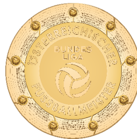
Admiral Bundesliga Illustration detailliert