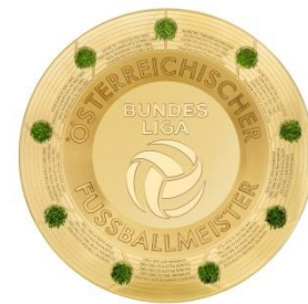
Keine illustrativen Zusatzeffekte