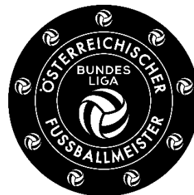
Admiral Bundesliga Piktogramm