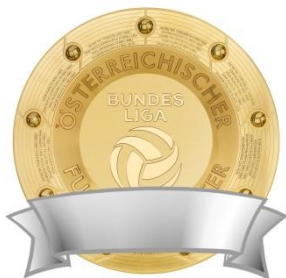
Keine zusätzlichen Elemente