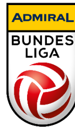
Bewerbslogo höchste Spielklasse