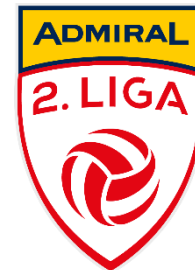
Bewerbslogo zweithöchste Spielklasse